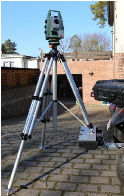
Das System im Einsatz und