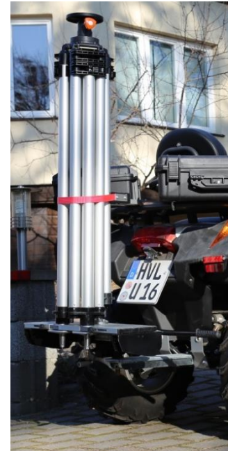
vorbereitet für den Transport.