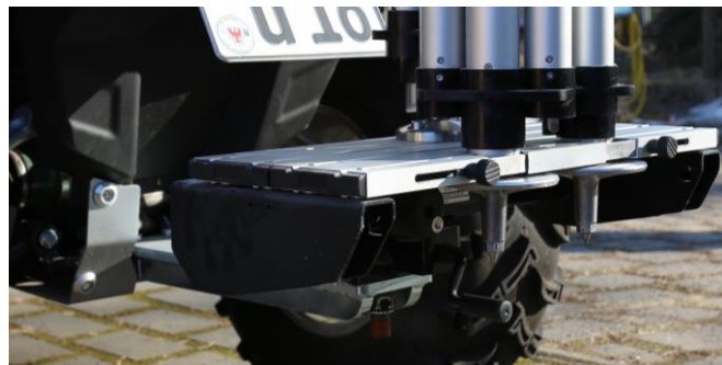
Die Verlängerung der Anhängerkupplung und die daran angekoppelte Stativhalterung.